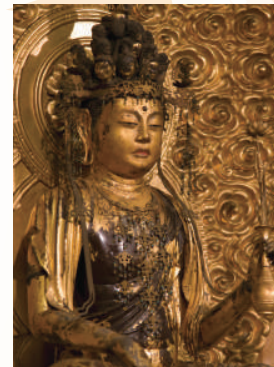
十一面観音菩薩坐像《重文》

鎌倉時代作の木造十一面観音坐像(重文)。十一面観音像の坐像は珍しく、引き締まった体躯しなやかに流れる着衣、尊顔、いつまでも眺めていたくなる美しさです。修理時に像内から発見された文書により、元禄十年(1697)にも修復をしていることが知られ、現在の台座・光背はこの時の作とされます。 【アクセス】JR 加茂駅から徒歩約 15 分