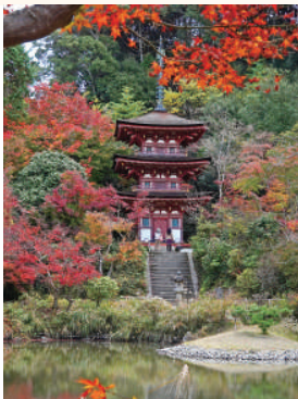
*雨天・荒天のときは中止の場合あり

池の東側に位置する三重塔《国宝》。祀られているのは薬師如来坐像(重文)です。本堂の九体阿彌陀如来坐像より 60 年前に造立されました。現世の苦勞を乗り越え、前に進むための力を薬として与えてくれる仏さまです。 【アクセス】JR加茂駅から木津川市コミュニティバス当尾線「浄瑠璃寺前」下車すぐ