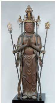
不空羂索観音立像

行基の開基と伝えられる燈明寺。本堂、三重塔は、現在、横浜市の三渓園に移築されています。本堂跡地に建てられた収蔵庫には、5 軀の観音像を初め、寺に伝えられた文化財が収められています。不空羂索観音立像は、修理の際に頭部から文書が発見され、一日で造られた『一日造立仏』として注目されています。