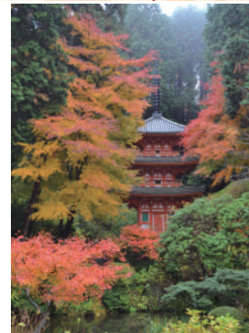
*雨天・荒天のときは中止の場合あり

夏はカラフルなアジサイに彩られる三重塔(重文)。秋は赤く染め上げられます。期間中の土日祝日は三重塔初層を特別開帳(晴天時のみ)。紅葉に負けない鮮やかな内部をご覧いただくことができます。 【アクセス】JR 加茂駅から木津川市コミュニティバス当尾線「岩船寺」下車すぐ