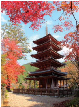
*拝観料: 11/8~600 円

屋外にある五重塔としては室生寺に次いで小さい海住山寺の五重塔《国宝》。裳階と呼ばれる庇をもつ五重の塔は法隆寺の他はこの塔のみです。内陣は厨子風に造られ、華麗な彩色が施されている。 【アクセス】JR 加茂駅から木津川市コミュニティバス奥畑線「海住山寺口」下車徒歩約 20 分(平日運行)、JR 加茂駅から奈良交通バス和束小杉行き「岡崎」下車徒歩約 40 分