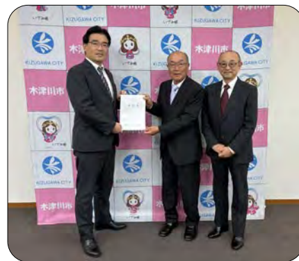
木津川市長要望活動