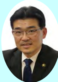
木津川市長 谷口雄一