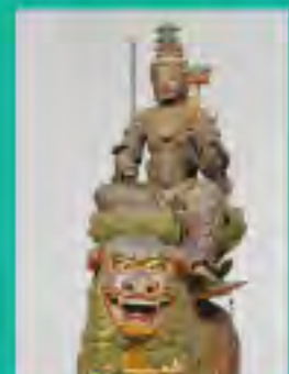
大智寺 文殊菩薩騎獅像(重文)