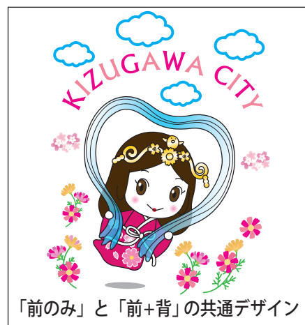
「前のみ」と「前+背」の共通デザイン