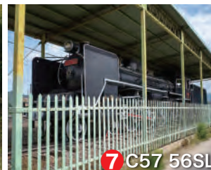
7 C57 56SL