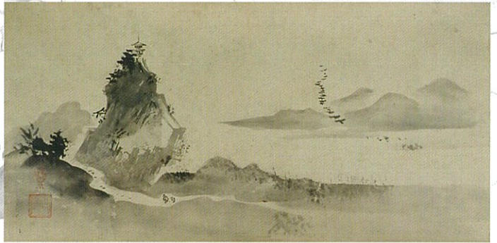
狩野興也筆 「瀟湘八景図巻」(部分) 個人蔵