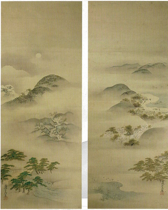
狩野常信筆「八幡八景圖」(双幅) 個人蔵

今回の展覧会では、こうした石清水八幡宮を中心とする近世の文化や、その担い手であつた神人の世界に焦点を当てて、江戸時代の南山城の地域相を見直します。